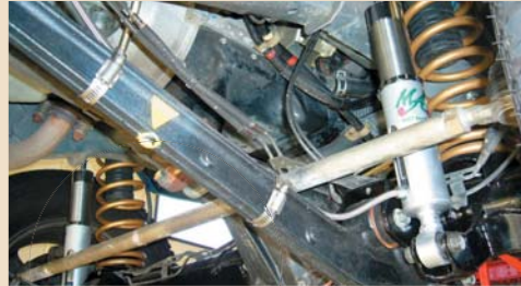
オリジナルショック 装着