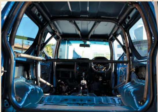
ロールケージ 制作